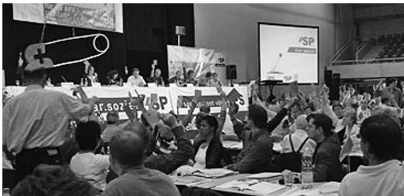
Parteitag der SPS in Sursee

Neuer Internetauftritt unter: www.sp-bern-ost.ch