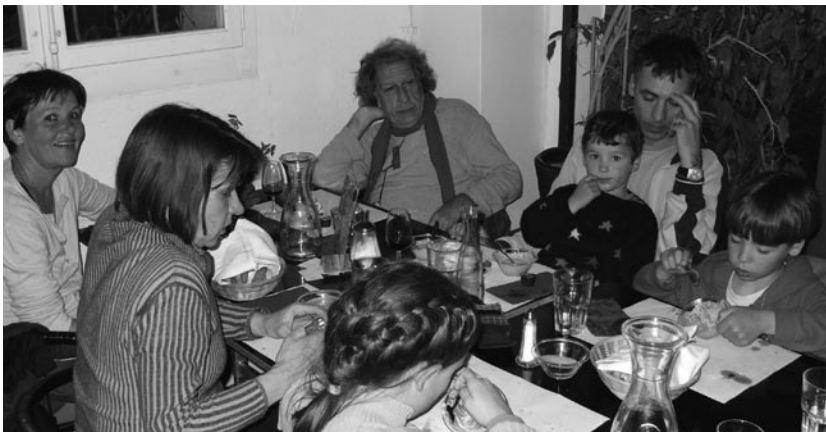
Impressionen von der 1. Mai Veranstaltung im Punto